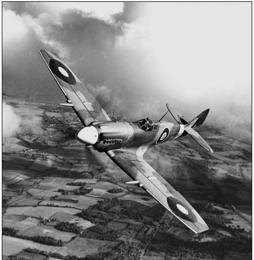
Un Spitfire MK XII maintenu par Repaircraft durant les années 40

Grâce aux efforts conjugués de nos chercheurs, ingénieurs, acheteurs et inspecteurs d'assurance qualité hautement qualifiés et expérimentés auxquels vient s'ajouter un système de gestion et d'exploitation entièrement informatisé et intégré, nous sommes à même d'offrir un soutien total.