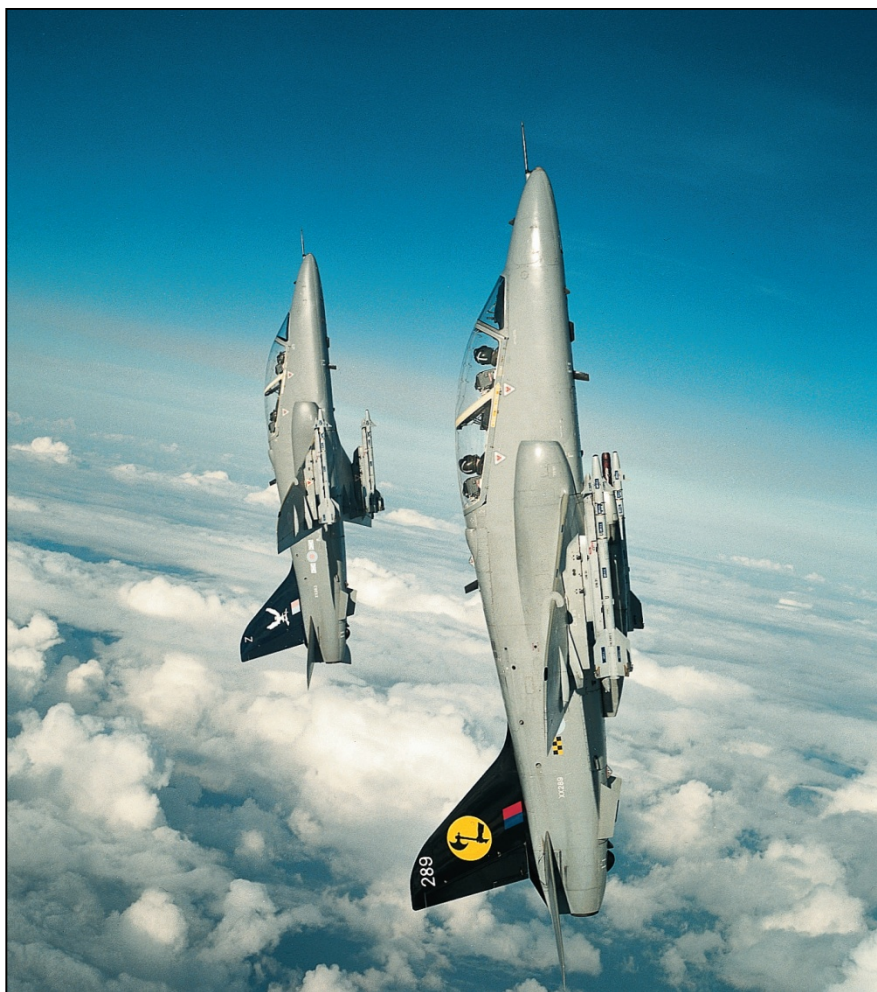
Avions Hawk de la Royal Air Force Britannique