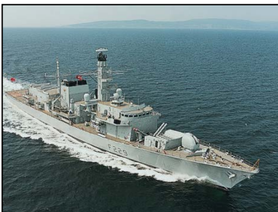
Frégate de type 23