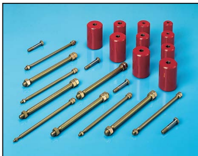
Kit d'entretien fabriqué par Repaircraft pour obusier de 155 mm

Repaircraft fournit des pièces de rechange et des systèmes pour tous les types de véhicules de combat, lance-missiles, obusiers, équipements de construction de ponts, transporteurs, camions, remorques, véhicules de servitude légers, équipement de ravitaillement, générateurs, équipement de transmission, équipement de surveillance etc.