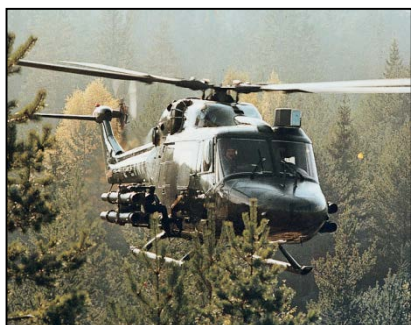
Hélicoptère Lynx armé de missiles TOW