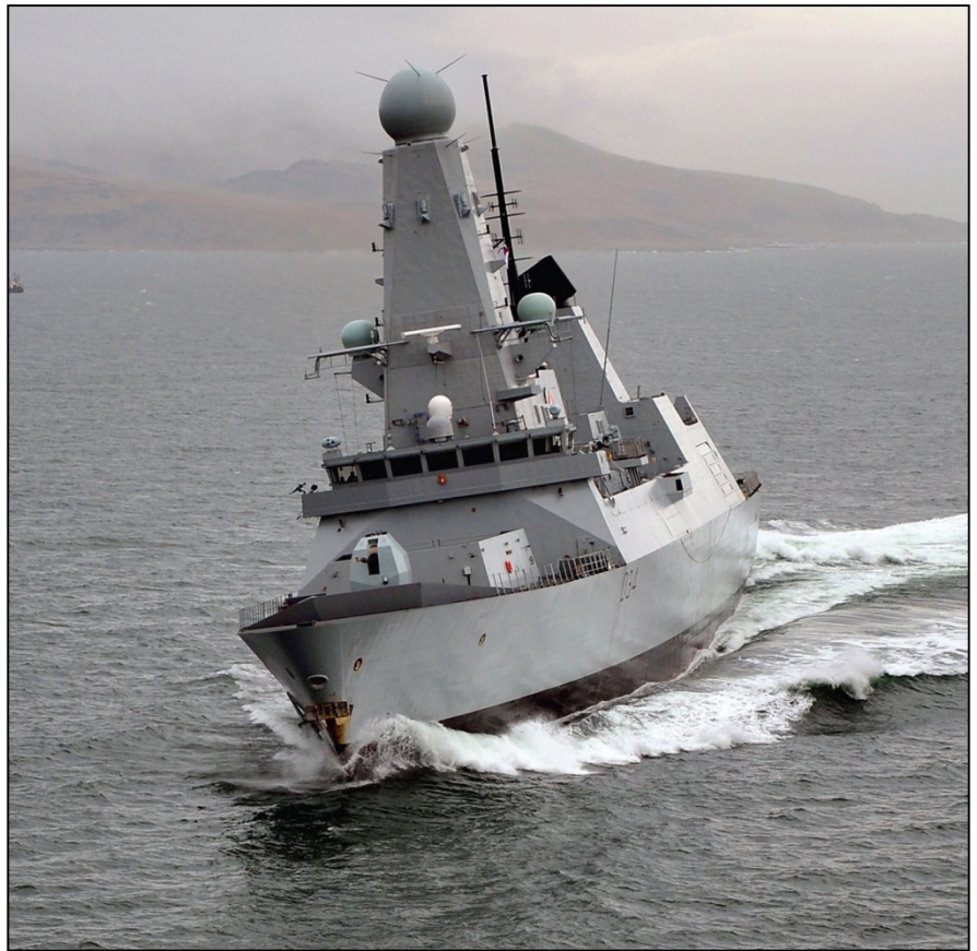
HMS Diamond, de la Royal Navy Britannique

Transformateurs remplis d'huile résistants aux chocs et divers composants électriques pour un projet d'entretien de radar naval