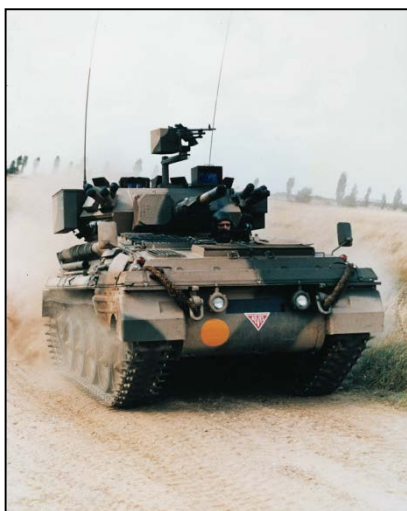
Char léger Scorpion