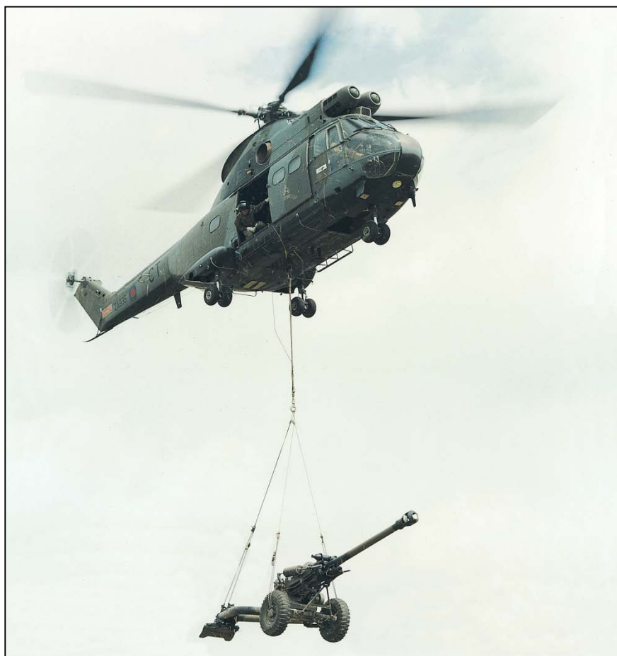
Canon de campagne de 105 mm transporté par un hélicoptère Puma