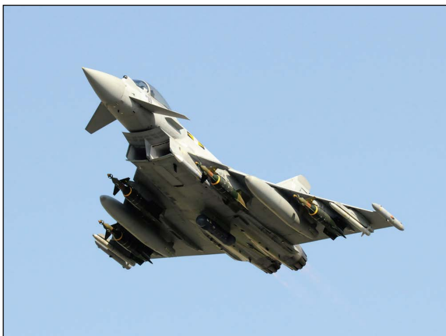
Avion Typhoon de la Royal Air Force Britannique