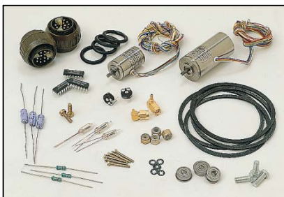
Elément d'un ensemble de pièces de rechange destinées au système de missiles