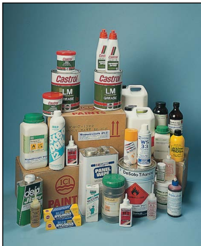
Peintures, produits d'étanchéité, adhésifs et lubrifiants etc. fournis par Repaircraft

Repaircraft fournit des pièces de rechange et des systèmes pour tous les types d'avions, hélicoptères, missiles, armements, équipement aéro-électronique, équipement de surveillance, matériel de support au sol, simulateurs de vol etc.