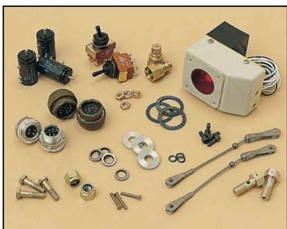
Divers composants pour un projet de modification/mise à jour de Repaircraft